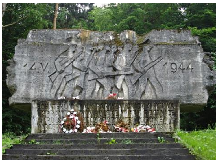
Fot. 14 Pomnik powstańców w Rąbłowie (autor: Leszek Blaskinski)