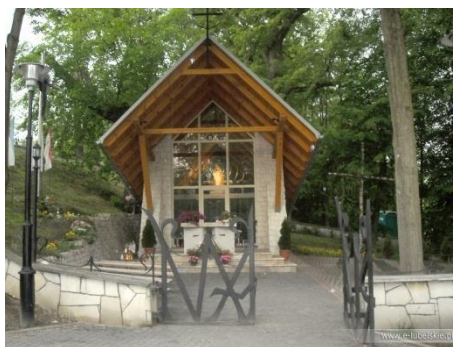
Fot. 5 Kapliczka „Na Zjawieniu” Kębło