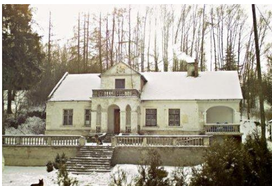
Fot. 18 Zespół dworski w Łąkach (autor: J.K.Wąciór)