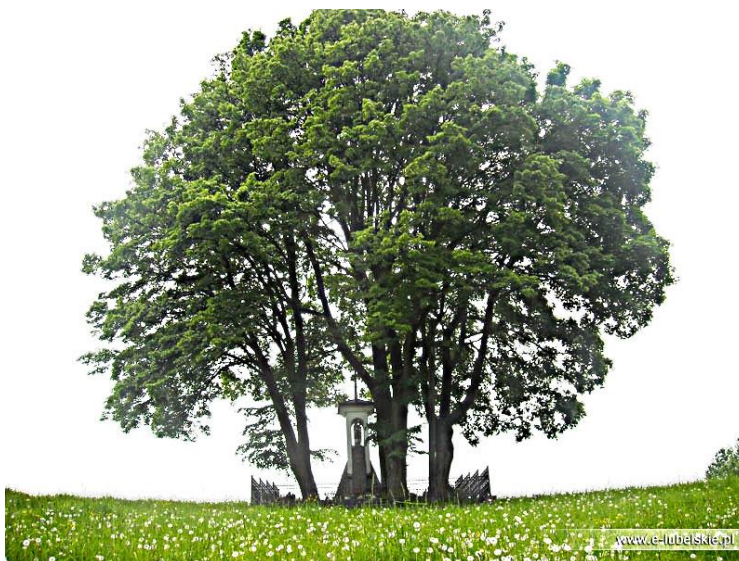
Fot. 22 Kapliczka "Na wzgórzu" Kębło

wyzdrowienie z ciężkich chorób, epidemii lub dla uczczenia ważnych wydarzeń figury, krzyże przydrożne, kościół i kaplice na wzgórzu zamkowym oraz cmentarz grzebalny w Mareczkach.