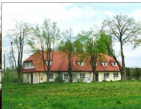
Fot. 19 Zespół podworski w Łopatkach