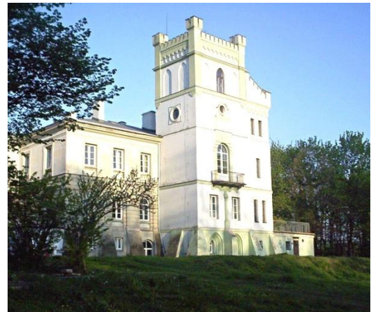
Fot. 17 Zespół pałacowo – parkowy w Celejowie