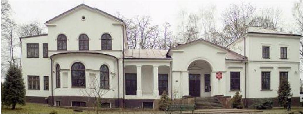
Fot. 15 Zespół pałacowo – parkowy w Kęble