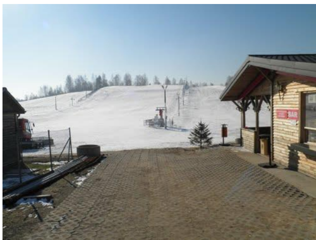
Fot. 23 Celejów. Stok narciarski (autor: sp. z.o.o)