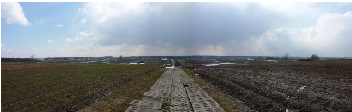
Fot. 25 Polkowszczyzna. Teren przeznaczony pod Zespół sportowo-rekreacyjny „Pole golfowe Polkowszczyzna”