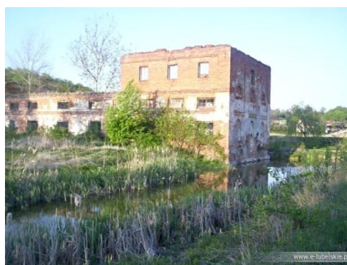
Fot. 21 Ruiny Papierni w Celejowie