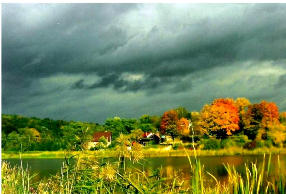
Fot. 2 Celejów. Dolina rzeki Bystrej (autor J. Jamiolkowska 2009)

Gmina Wąwolnica oraz jej sąsiedztwo jest jedynym w Europie miejscem o mikroklimacie pozwalającym na prowadzenie profilaktyki i leczenia układu krążenia i chorób serca. Szczególną rolę w tym procesie odgrywa mikroklimat. Na terenie Celejowa planowane jest świadczenie usług związanych z wodami geotermalnymi oraz usługi uzdrowiskowe.