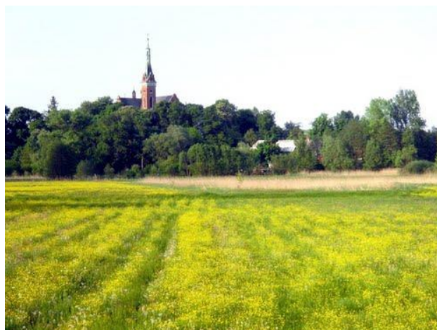
Fot. 1 Panorama na Wzgórze Kościelne w Wąwolnicy (autor: Hasior)

W odniesieniu do tych stref obowiązują ochrona przed: