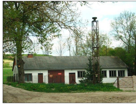
Fot. 4 OSP Zawada