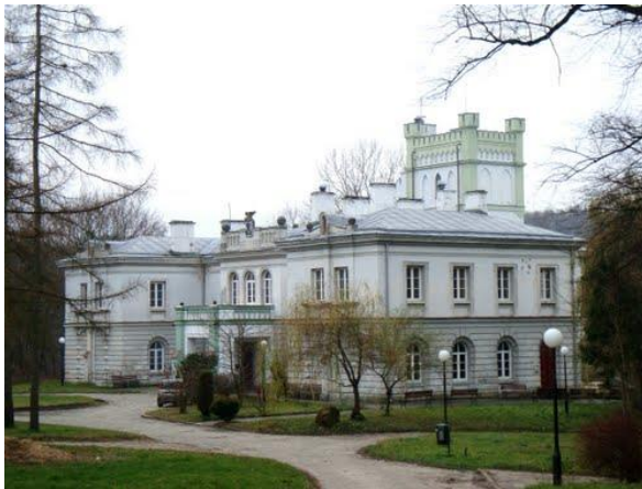
Fot. 16 Zespół pałacowo – parkowy w Celejowie (autor: Barbara Anna)