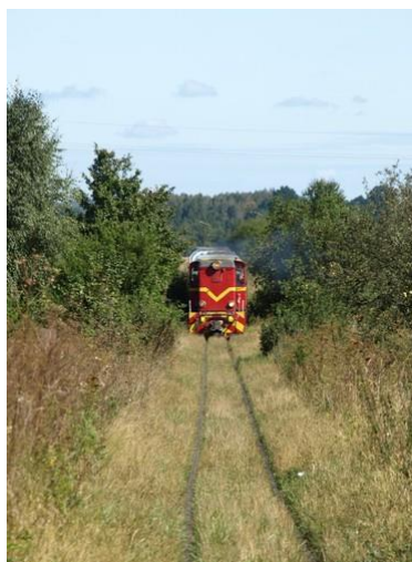
Fot. 24 Nałęczowska Kolej Dojazdowa