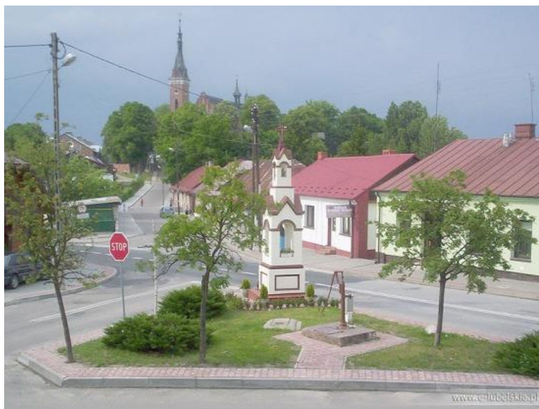
Fot. 8 Rynek Wąwolnica, skrzyżowanie ul. Dulęby z ul. Zamkową

Dla całości należy opracować profesjonalny projekt rewitalizacji w oparciu o wytyczne konserwatorskie określające m.in. obowiązujące parametry dla zabudowy.