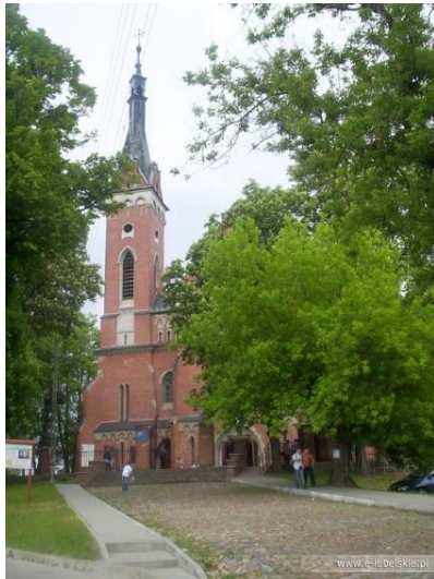
Fot. 11 Zespół sakralny na wzgórzu zamkowym w Wąwolnicy

rejestrze zabytków jako zespół wraz z relikdami zamkowymi i tzw. starą plebanią, ogrodzeniem, drzewostanem oraz kaplicą ;