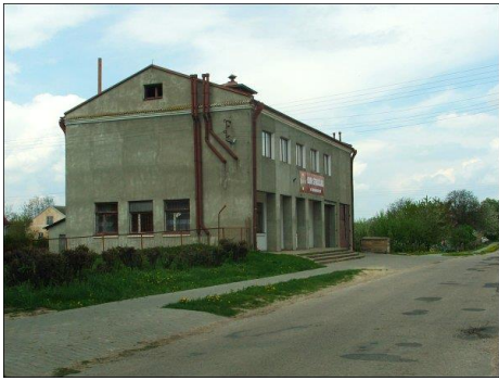
Fot. 3 OSP Karmanowice