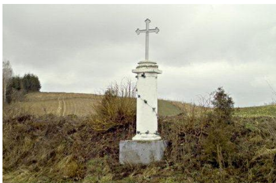
Fot. 13 Dwie kolumny tokańskie w Rąbłowie