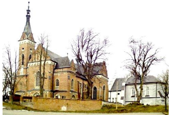
Fot. 12 Zespół sakralny na wzgórzu zamkowym w Wąwolnicy (autor: J.K. Wąciór)