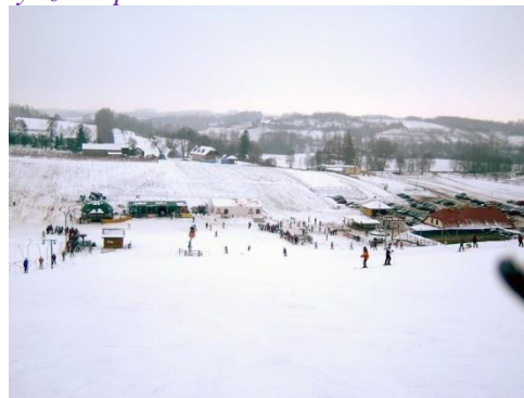
Fot. 7 Rąbłów, Ośrodek sportów letnich i zimowych „Nart Sport”