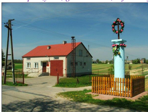
Fot. 6 OSP Rąbłów (dwarowery)