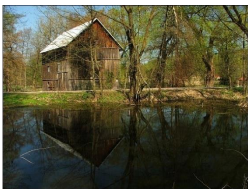
Fot. 20 Młyn w Ilki